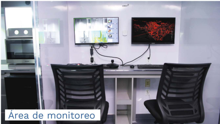
Área de monitoreo