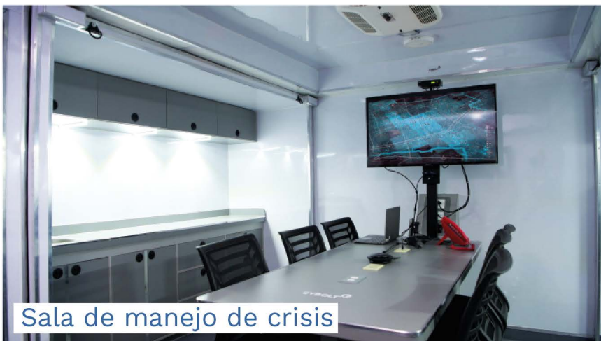
Sala de manejo de crisis